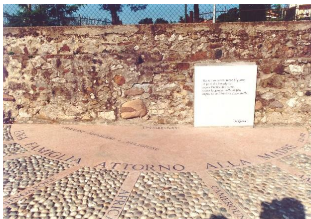
UNA FAMIGLIA ATTORNO ALLA MADRE RODZINA WOKÓŁ MATKI

Podobnie jak w poprzednich wydaniach, byłoby czymś dobrym, aby w procesie przygotowania obecnego katalogu odnowić kontakty i nawiązać nowe relacje. Dziękujemy Panu za naszą jedność jako Córek św. Anieli, tak jak to widzimy w symbolu w Grezze « rodzina wokół Matki »